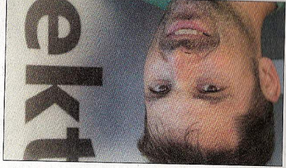
Licht aus ab iPhone